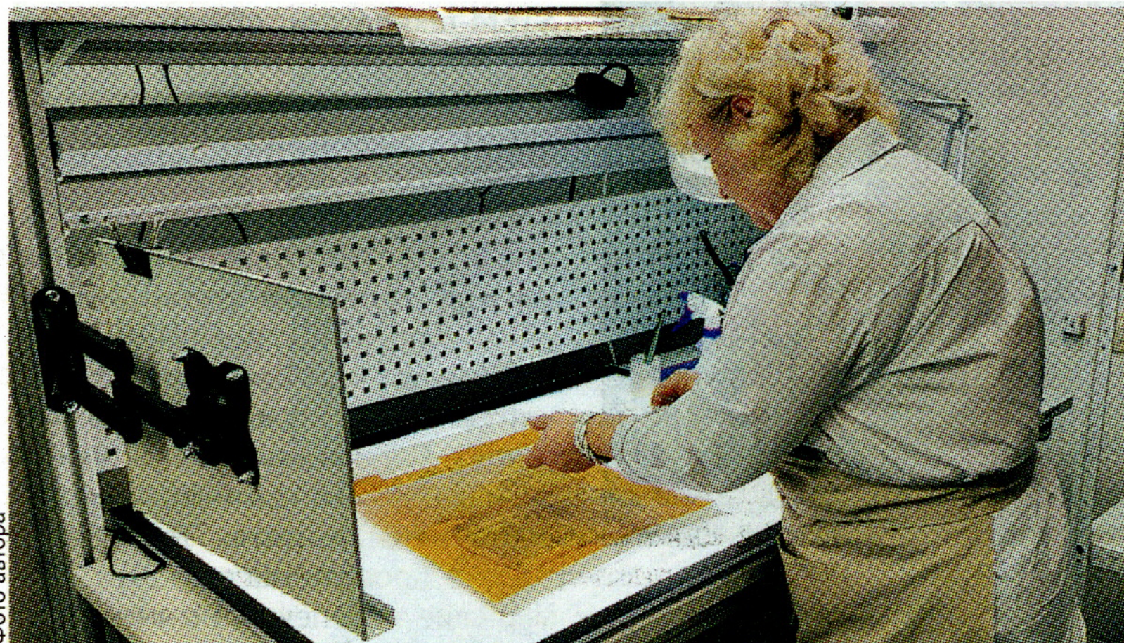
Новое оборудование позволит качественнее подойти к процессам консервации и реставрации.

– Мы получили более 160 наименований оборудования в рамках проекта. Наши специалисты прошли обучение, чтобы работать по новым технологиям и с новыми материалами. Раньше реставрационные рабо-